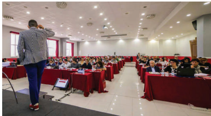
GNB ITALIA offre consulenze a molti clienti, ma soprattutto a imprese e professionisti

I consulenti aziendali sono disponibili per i clienti 7 giorni su 7, 24 ore al giorno. Che si parli di puntare su strategie di acquisizione e fidelizzazione del cliente, piuttosto che sulla presa di coscienza della necessità di un business plan adeguato ai bisogni aziendali e che permetta all'imprenditore di fare utile, GNB ITALIA offre un percorso di affiancamento e crescita graduale per ottenere risultati costanti.